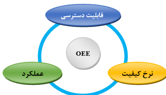
شکل ۱- اثربخشی کلی تجهیزات.